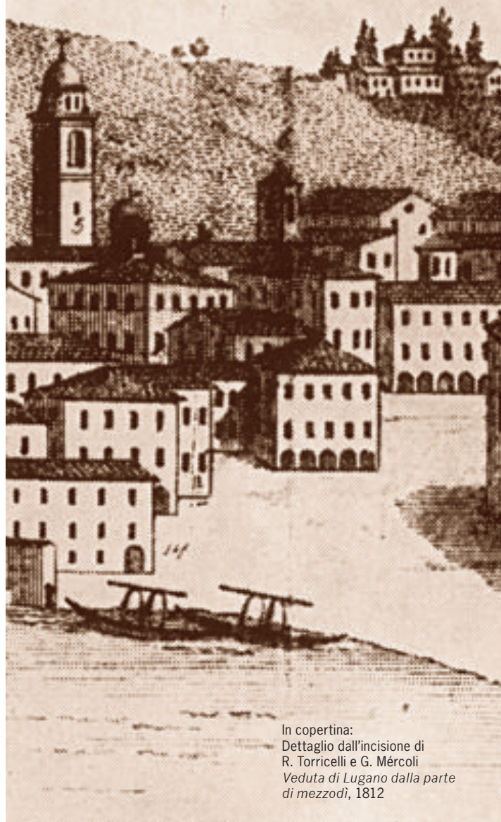
In copertina: Dettaglio dall'incisione di R. Torricelli e G. Mércoli Veduta di Lugano dalla parte di mezzodi , 1812