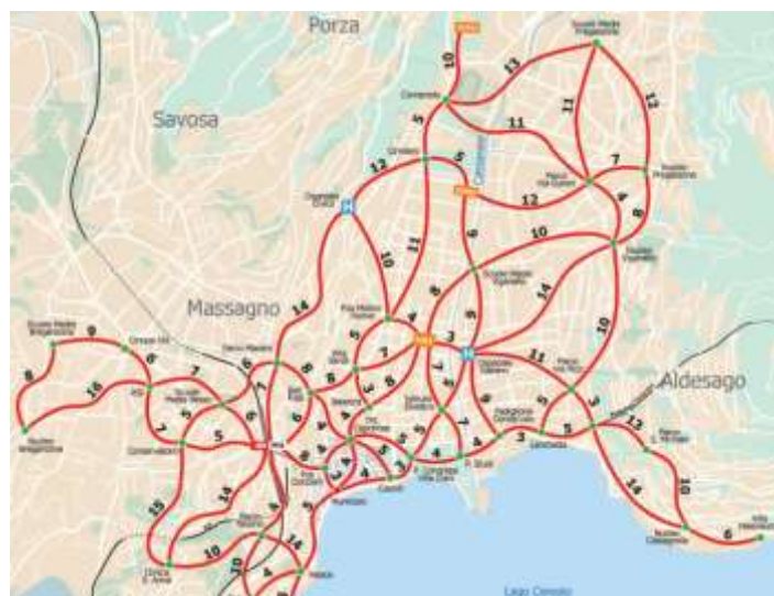
Carta dei tempi di percorrenza a piedi